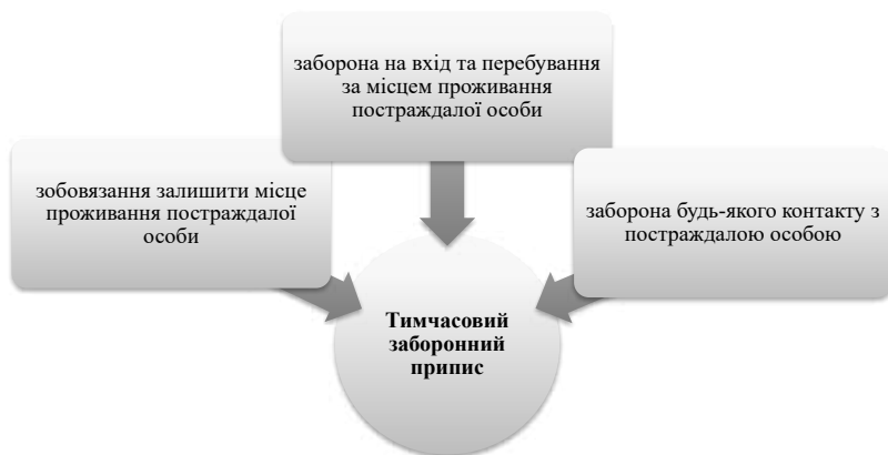
Рис. 1. Форми термінового заборонного припису, що можуть вноситися кривднику постраждалої особи від домашнього насилля

Терміновий заборонний припис щодо кривдника може бути винесений уповноваженим підрозділом органу Національної поліції України, якщо існує реальна загроза життю та здоров'ю постраждалої людини для негайного припинення дій або загрози вчинення дій, спрямованих на насилля над людиною, попередження повторного вчинення акту домашнього насилля. Терміновий заборонний припис може бути винесений в декількох формах (рис. 1).