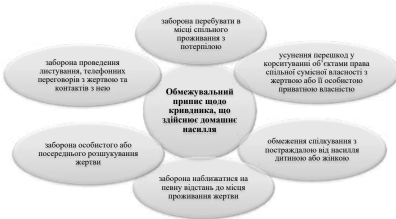
Рис. 2. Заходи, що можуть бути зазначені в обмежувальному записі щодо кривдника, що вчиняє домашнє насилля

Обмежувальний припис щодо кривдника є заходом тимчасового обмеження його прав або покладення обов'язків на нього, спрямованих на забезпечення безпеки постраждалої особи, та полягає в декількох обмежувальних заходах (рис. 2).