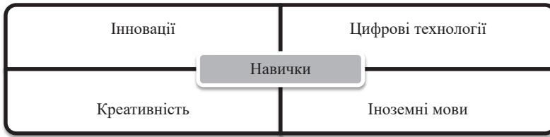
Рис. 2. Найбільш затребувані навички серед спеціалістів в умовах глобалізації