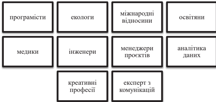
Рис. 3. Десять найбільш затребуваних професій в умовах глобальних викликів

вищої освіти у цьому контексті – забезпечити гнучкість у підходах до навчання та здатність швидко реагувати на виклики сучасності, готуючи студентів до ефективної роботи у міжнародному та багатокультурному середовищі.